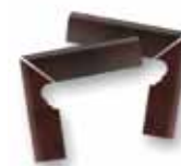
9005/9006 Stufensockelpaar links/rechts